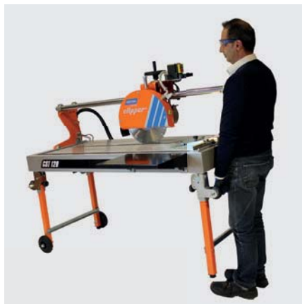
LEICHTER TRANSPORT DANK EINKLAPPBARER FÜSSE UND TRANSPORTRÄDER.