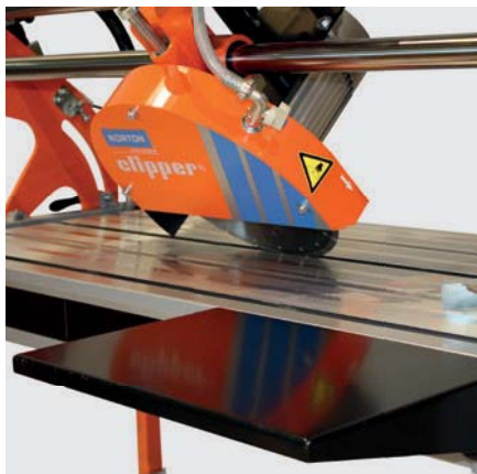
AUFLAGETISCH IM LIEFERUMFANG ENTHALTEN