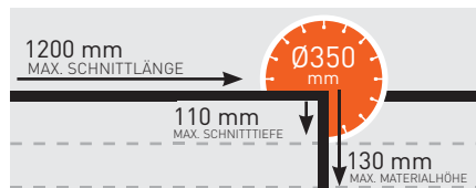
MAX. SCHNITTtiefe - CST 120